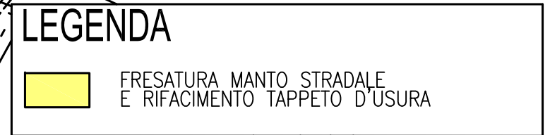
TAVOLA N. 3/a - Scala 1:2000 Via Arginotto - frazione Ponteventuno